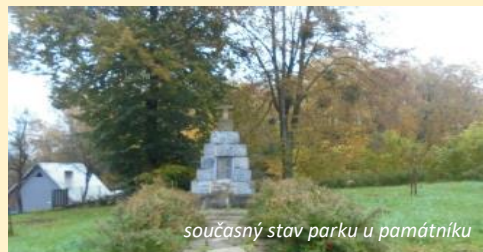
současný stav parku u památníku

Občané města Kelč se pak mohou těšit na revitalizaci zeleně obou zdejších sídlišť – Sídliště Pod Kateřinkou a Sídliště Za školou, které se nacházejí přímo v centru města. Také zde dojde po ošetření stávající zeleně a odstranění nevhodných dřevin k výsadbě nových stromů, keřů a instalaci odpočinkových laviček. V lokalitě budou vybudovány také menší skládané kamenné zídky. Kromě zeleně v centru budou zrevitalizovány také polní cesty na Strážné, které budou upraveny a osázeny alejí. Vznikne ideální místo pro procházky místních i přespolních, které vede až do blízkosti památníku kelečského pokladu nalezeného v roce 1938.