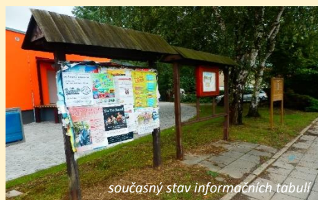
současný stav informačních tabulí